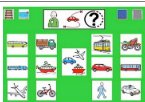
Tableau de communication