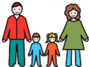
Picto famille (couleur, noir et blanc)